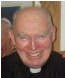
отец Филипп Рейли

То, что делает «уличных консультантов» успешными, так это молитвенная поддержка. Кто ее оказывает, эту поддержку? Это молящиеся люди на больших ежемесячных молитвенных бдениях; также те, кто молится снаружи абортария еженедельно и ежедневно, в то время как консультант пытается разговаривать с пришедшей на аборт женщиной. Также те молитвенники, чьи рабочие или семейные обязанности не позволяют им физически быть возле абортария, но они молятся за консультантов (служащие, мамы с маленькими детьми, монахи и затворники). Каждый день, когда я возвращаюсь в монастырь, сестры-монахини хотят знать, как они поработали. Когда я говорю им, что у меня хорошие новости, они отвечают: «Вы же знаете, Отец, это все благодаря молитве». И они правы, ведь просто раздавая розарии многим матерям снаружи абортария, внутри него решение меняется в пользу жизни. Я также прошу молиться и за тех, кто, в конечном счете, возьмет эти розарии. Теперь уже все знают, насколько чудесно может молитва на розарии уводить женщин из абортария.